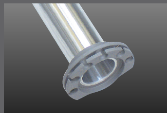
スロットルスリーブ