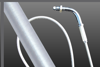
スロットルケーブル