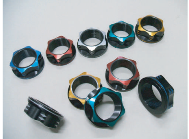
シャープなイメージの「カンツウタイプ」