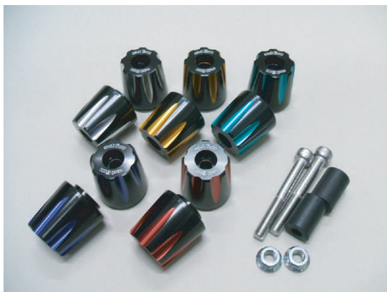
形状サイズ 先端部外径30mm 取り付け部外径35mm 長さ38mm