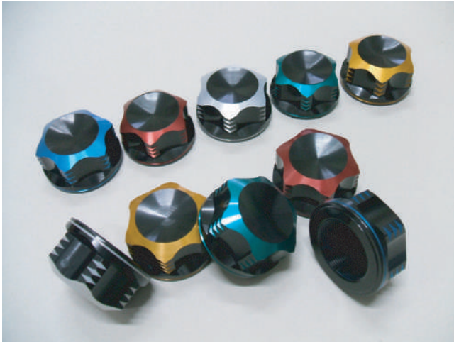
定番の「フクロタイプ」

■ ステムナット ver II に『Wアルマイト』がラインナップ！！ ブラックベースに再切削後のアルマイトで、ハンドル周り的高级感を演出します。