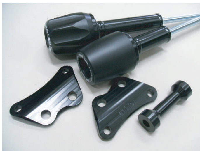
SR400Fi パフォーマンスダンパー対応