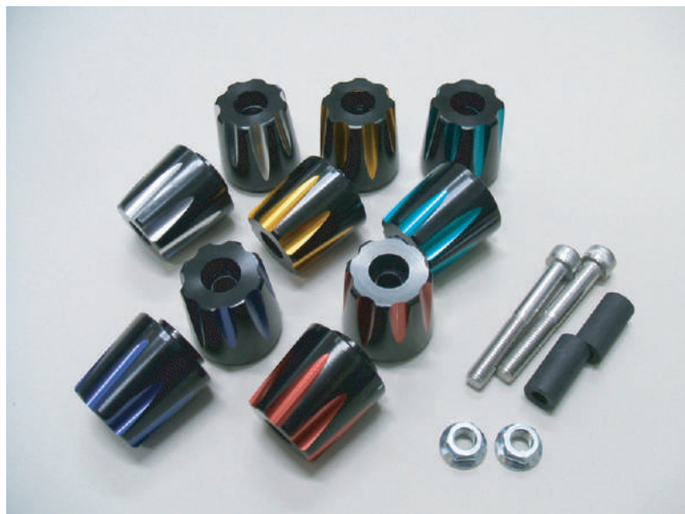
ブラックベースに再切削後のWアルマイト