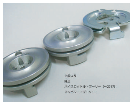
ストッパー形状の違い