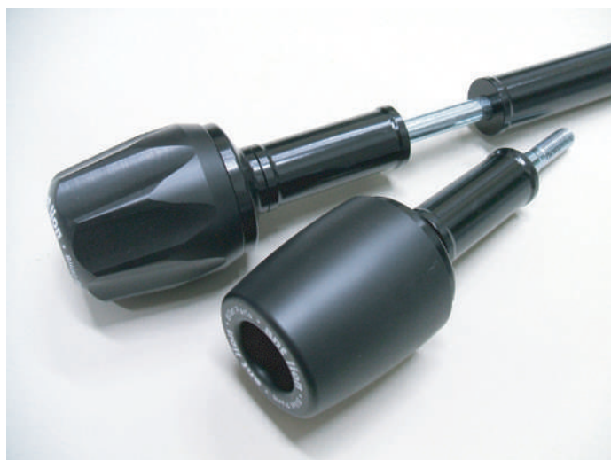
取り付けカラーもブラックで統一