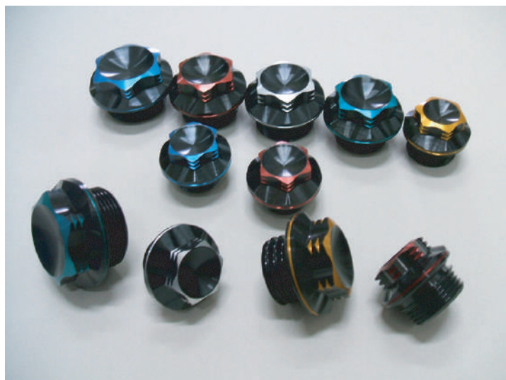
ブラックベースに再切削後のWアルマイト