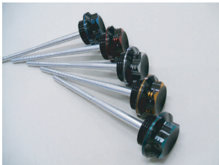
SR400専用 (オイルレベルゲージ付き)