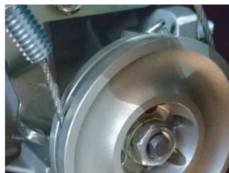
装着イメージ(フルパワー・プーリー)